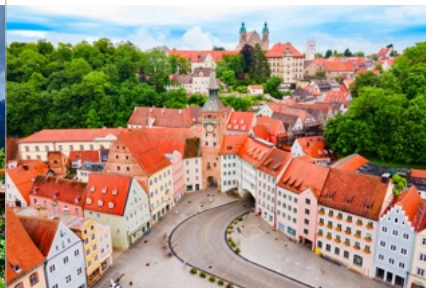
LANDSBERG AM LECH